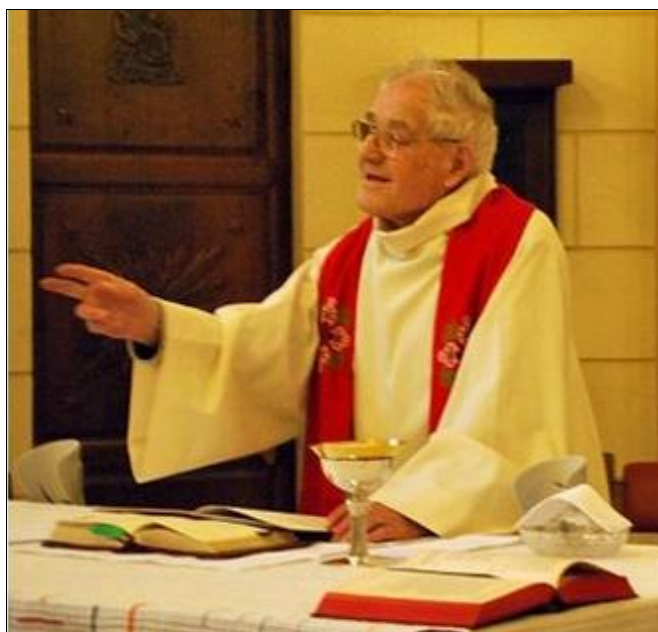
Messe du 7 mars 2011 à la Maison Marie-Thérèse (Paris XIV ème )